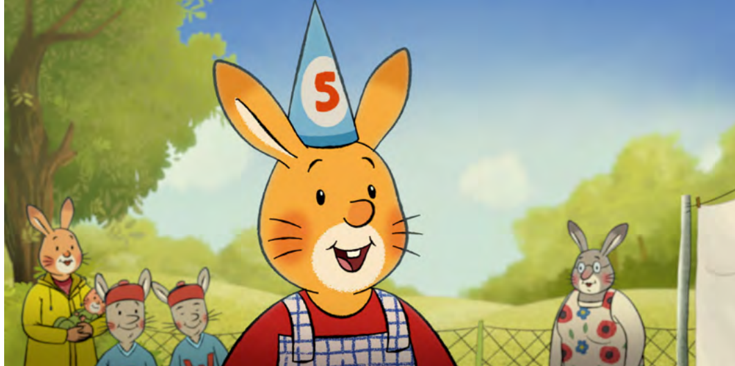
Najlepsze urodziny Królika Karola