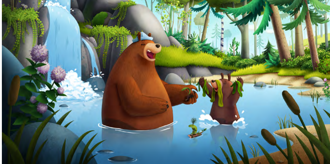
Przytul mnie. Poszukiwacze miodu