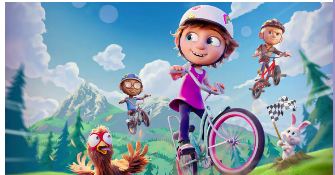
Ella Bella Bingo