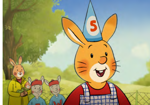
Najlepsze urodziny Królika Karola