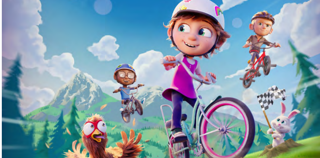
Ella Bella Bingo